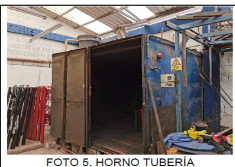
FOTO 5. HORNO TUBERÍA