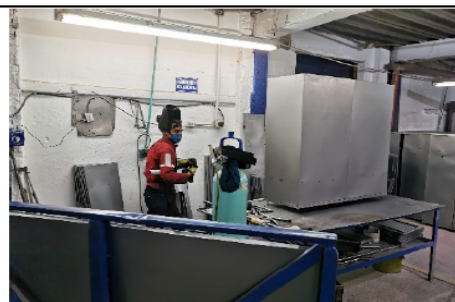
FOTO 6. ÁREA DE ARMADO DE MUEBLES, SOLDADURA