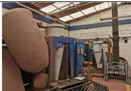
FOTO 3. CABINAS PINTURA, CICLÓN Y FILTRO