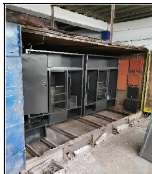
FOTO 4. HORNO LAMINA